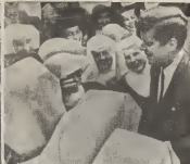
Riba e promer grafica un muchu hom'er ta durante president Kennedy un bombini na Alemania, mientras e polisnan ta want e multitud. Riba e otro e cocurnan di un concert na Irlanda ta saludando e president, na unda un prima di e president ta Superiora.